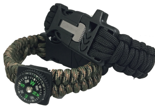
これぞサバイバル